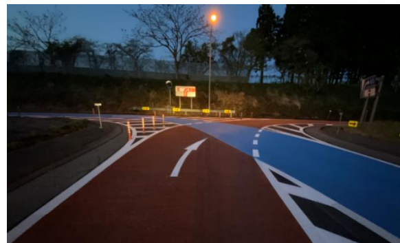
舗装補修後イメージ