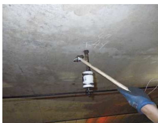
トンネル内設備点検写真