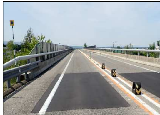
舗装補修後イメージ