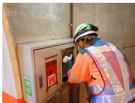
トンネル内設備点検写真