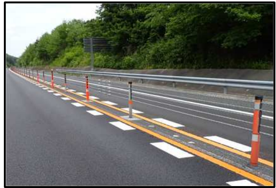
車線区分柵設置工事 施工後写真(イメージ)