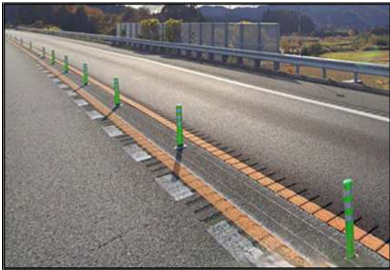
車線区分柵設置工事 施工前写真

常磐道 上下線 広野IC～常磐富岡ICにおいて、車線区分柵設置工事を実施します。この工事を行う区間は1車線であり、工事実施にあたって通常の手線規制では施工が出来ないことから、通行止めを実施して作業を行う必要があります。お客さまへ極力ご迷惑をおかけしないよう、交通量が少ない平日の夜間に通行止めを行い、工事を集中的かつ効率的に実施します。安全・快適に高速道路をご利用いただくために必要な工事ですので、ご理解とご協力をお願いします。