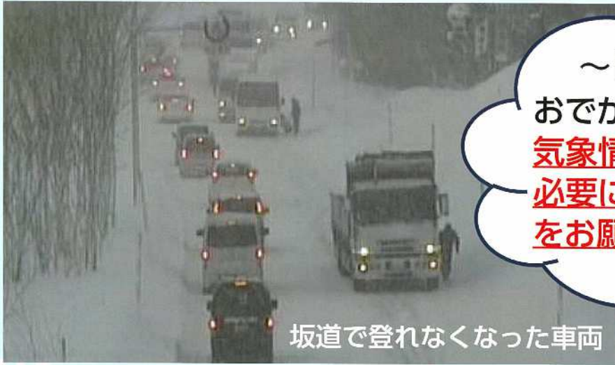
坂道で登れなくなった車両

～ドライバーの皆さまへ～ おでかけの際は、 気象情報・道路情報に注意し、 必要に応じチェーン等の装備 をお願いします。