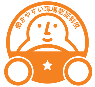
「一つ星」認証マーク

今年度は、制度の浸透と基本的な取り組みの定着を図るための試行実施期間とし、「一つ星」に限定して申請を受け付けます。 基本となる法令遵守等に加えて、各社の前向きな自発的取組み、改善取組みを積極的に評価することとしています。また、小規模事業者の方にこそチャレンジいただけるものとなるよう、初年度はシンプルな制度となっています。 申請受付・認証業務は、国土交通省から、本制度の実施団体に選定された「一般財団法人日本海事協会（通称：ClassNK）」が行います。