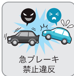
急ブレーキ 禁止違反