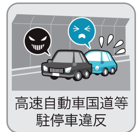
高速自動車国道等 駐停車違反