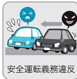
安全運転義務違反