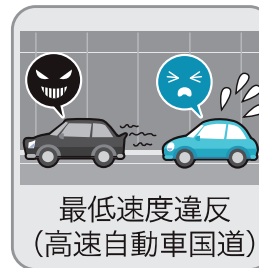
最低速度違反 (高速自動車国道)