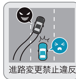
進路変更禁止違反