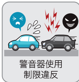
警音器使用 制限違反