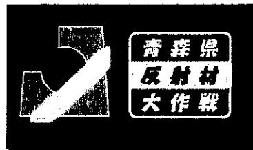
青森県反射材大作戦ロゴマーク