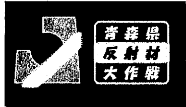
青森県反射材大作戦ロゴマーク